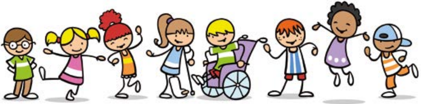
Illustration: Robert Kneschke

■ Warme Herbstsonne, klare Fernsicht, feine Spinnfäden an Sträuchern, Bäumen und Gräsern – das sind typische Merkmale des Altweibersommers. Doch woher kommt der Name und was hat es mit dem Phänomen auf sich? Hier erfahrt ihr Spannendes zu diesem Thema. Viel Spaß beim Lesen wünscht euch Annette Schacht.