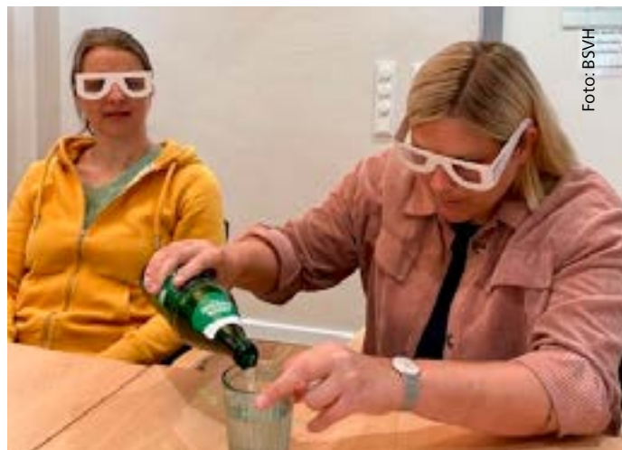
📷 Selbst ausprobieren war die Aufgabenstellung für das Team von VW

Jedoch geht es noch um mehr. Seit 2017 unterliegen bestimmte Unternehmen durch eine EU-Verordnung der sogenannten CSR-Berichtspflicht. CSR steht für die internationale Bezeichnung „Corporate Social Responsibility“. Übertragen ist mit dem Begriff die gesellschaftliche Unternehmensverantwortung oder Unternehmerische Sozialverantwortung gemeint; der freiwillige Beitrag der Wirtschaft zu einer nachhaltigen Entwicklung, der über die gesetzlichen Forderungen hinausgeht. Die verpflichteten Unternehmen sollen sich im Rahmen ihrer allgemeinen Berichtspflicht - in den Lageberichten oder separaten Nachhaltigkeitsberichten - eben auch über das verantwortliche unternehmerische Handeln in der eigentlichen Geschäftstätigkeit, über die Berücksichtigung und Implementierung ökologisch relevanter Aspekte bis hin zu den Beziehungen und Entwicklungschancen der Mitarbeiterschaft sowie zum Austausch mit den relevanten Anspruchs- bzw. Interessengruppen (Stakeholdern) erklären. Die IHK in Frankfurt am Main erläutert dazu: „Mit der Berichtspflicht soll ein nachhaltigeres und verantwortungsbewussteres Handeln der betroffenen Unternehmen unterstützt und