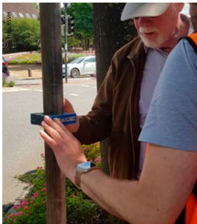
📷 Taktile Straßenschilder? Ein gelungenes Konzept?

Fazit: Die Informationen im Straßenraum für blinde und sehbehinderte Menschen zu verbessern, ist eine gute Idee und auch ihr Geld wert. Dies sollte aber in einem schlüssigen Gesamtkonzept erfolgen und nicht in Form einzelner Maßnahmen.